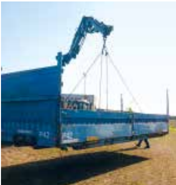
Grundrahmen 1 und 2 wurden mir von einem Kranfahrer zum Transport bereitgestellt.

Als Fundament für die Arche dient der Grundrahmen eines WAB-Planenaufbaus, besser gesagt zwei davon. Ich habe hierzu das gängige Standardformat mit 7450 mm × 2500 mm verwendet. Also zwei Grundrahmen mit einer Länge von je 7450 mm, wobei beim zweiten ein Stück von 1600 mm abgetrennt und am hinteren Ende des ersten angesetzt wurde, um so auf eine Gesamtlänge von 9050 mm zu kommen (dazu sogleich, Seite 84f.). Dies ist mit dem vorhandenen Fahrgestell die maximale Länge, mit der beim Transport die gesetzlichen Vorgaben zum Wendekreis noch eingehalten sind. Somit sind keine Sonderfahrtgenehmigungen nötig. Solche Planenaufbauten finde ich ab circa 500 Euro.