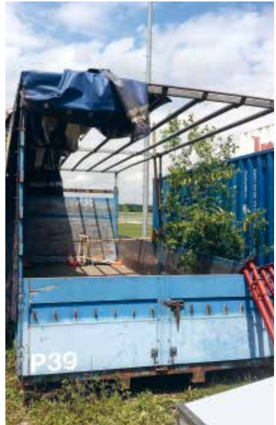
WAB-Planenaufbau bereits verwachsen, aber schon halb abgeplant