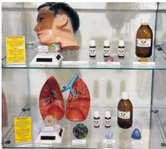
Abstimmung der Vitrinen in der Medizinabteilung auf den neuen Buchinhalt.