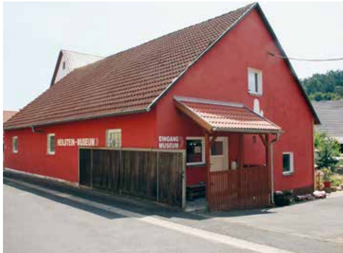
Das Heilstein-Museum in Stockheim in der Rhön.