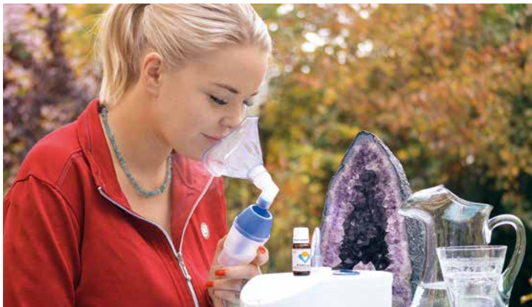
Kalt-feuchte Inhalation mit dem Vernebler ist die wirksamste Inhalationsmethode.