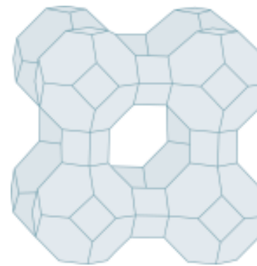
Hohlraum im Klinoptilolith-Kristallgitter

Durch Aluminiumatome hat Klinoptilolith eine anionische Gerüstladung. An der inneren und äußeren Oberfläche befinden sich daher bei aluminiumhaltigen Zeolithen Kationen, das heißt bewegliche negativ geladene Elektronen. In Klinoptilolith liegen diese Kationen häufig in gelöster Form